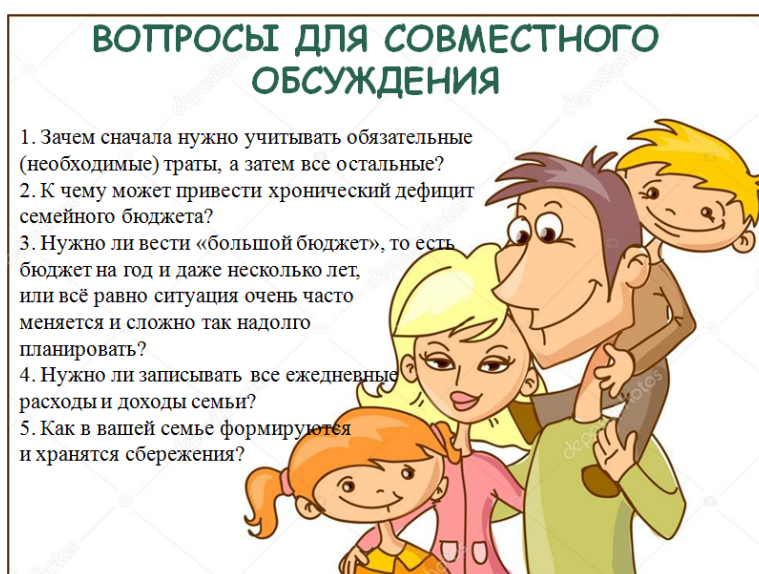
Рисунок 2 – Вариант вопросов для совместного обсуждения из домашнего задания по теме «Семейный бюджет»

В привычном понимании домашние задания направлены на помощь обучающимся в освоении изученного материала. Казалось бы, при совместном домашнем задании с этой проблемой просто должны помочь справиться родители. Однако мною разработаны блоки домашних заданий по каждому разделу программы, направленные на совместную работу обучающихся и родителей. Они включают: отдельные задания для детей, отдельные задания для родителей и вопросы для совместного обсуждения (Рисунок 2).